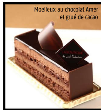
Moelleux au chocolat Amer et grué de cacao