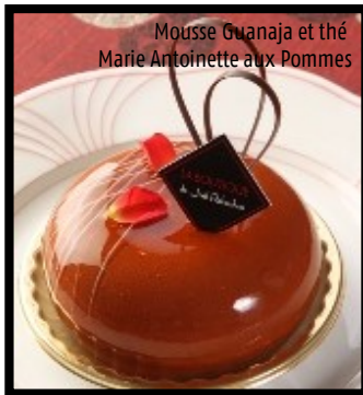
Mousse Guanaja et thé Marie-Antoinette aux Pommes

コーヒーまたは紅茶付き Accompagné d'un café ou de thé