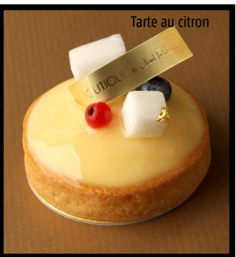
Tarte au citron