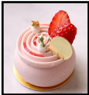
Tourbillon fraise citron トゥールビヨン

コーヒーまたは紅茶付き Accompagné d'un café ou d'un thé