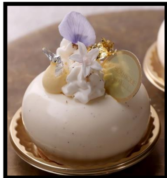
Cheese cake Tonka-Vanille チーズケーキ トンカ ヴァニージュ

マロンクリームとラム酒がほのかに香るモンブランに仕立てました *アルコールを含む