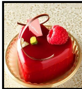
Cœur rouge ルージュ

冬限定のチーズケーキです。ふわりと香る、トンカとバニラの余韻をお楽しみいただけます