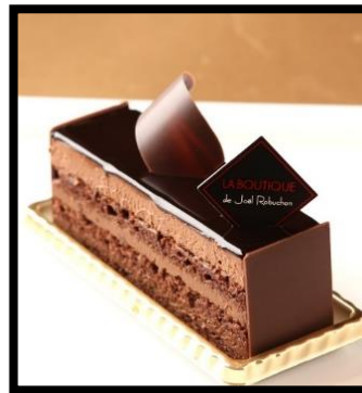
Moelleux au chocolat amer et grué de cacao

ヘーゼルナッツづくしのムースです キャラメリゼとクランブルをのせて食感にも変化を加えています